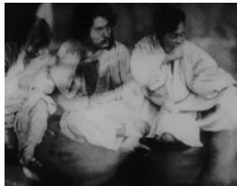
図 13 (1:05:32)