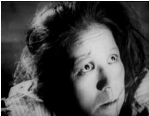
図 10 (0:07:47)