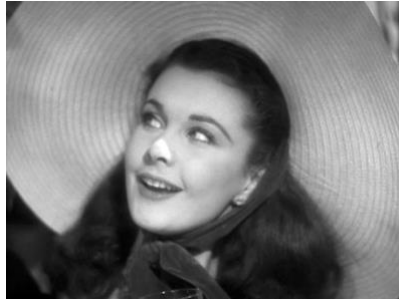
図 4 首を傾げる動作の反復 (Part1, 00:23:34)

首を傾げる動きは映画版に固有の演出だ。小説版において、男性たちに囲まれたスカーレットの様子は、「わざと何倍も陽気にはしゃぎ、取り巻きの若者たちと声をたてて笑い合」うとだけ記述されているが、映画版の場合、彼女は一連のやり取りの間、顔や目を動かし続け、ひとつの場所に落ち着けることがない (ミッチェル 1 巻 235)。さらに、牢獄にいるレット・バトラーの元へ金策に行く場面 (Part2, 00:26:14-00:28:14) や、後に 2 人目の夫となるフランク・ケネディ (キャロル・ナイ) に彼の恋人だったスエレンの近況を伝える場面 (Part2, 00:33:12-00:34:14) でも、彼女が首を傾けながら顔の向きを頻繁に変えたり、眼をうろうろさせたりするパフォーマンスが見られる。