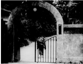
図 1 (0:13:54)

を精神病院に奪われた小使いは、娘も精神病患者に奪われるのである。家庭という私的領域における家長としての小使いの権限は、「病室」の鍵を医師に拾われてしまうと、医療という国家制度に包摂されてしまい、妻と娘を取り戻すのを夢見ることさえ妨げられてしまう。四方田の言うように、ここに近代医療制度への批評性を見ることは可能だろう ([2016] 270-273)。