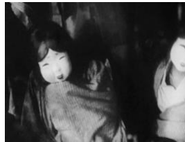
図 14 (1:07:38)

精神病患者のジェンダーは、騒動を治めることになる仮面によっても分割されている。衣笠は松澤病院で目撃した患者について、次のように述べている。