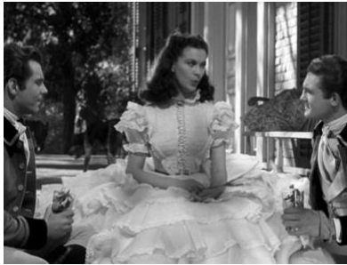
図3 演劇性が強調されたミザンセン (Part1, 00:07:09)

にある。スカーレットは、タールトン兄弟が忠告にも拘らず話し込んでいたので、ふと立ち上がり、カメラに背を向け、スカートの裾を大きく左右に揺らしながら画面奥へ歩き去る (Part1, 00:07:23)。焦った兄弟が引き留めると、彼女は2人の言葉を待っていたかのように立ち止まり、「そうね」と抑揚をつけて呟く (Part1, 00:07:25)。そして優雅に振り返り、身体を正面に向けたところで、「でも、覚えておきなさい。私は言ったわよ」と優しく警告する (Part1, 00:07:29)。また、この場面で見せたリーのパフォーマンスは、原作小説で「鈴のように丸くスカートがふくらむように腰を振る」(ミッチェル 2巻 94) とある、スカーレットの「淑女らしい」役割演技の描写そのものでもある。