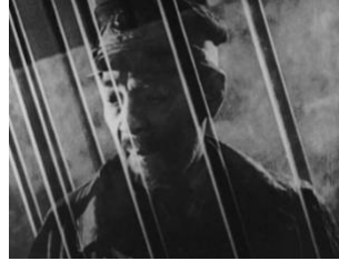
図 7 (0:07:28)