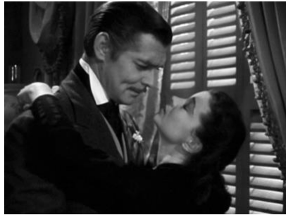
図6 身を投げ出すスカーレット (Part2, 01:03:46)

それまでスカーレットは演技を行うことで男性たちの注意や場を制御してきた。つまり、求愛してくる男性に対して彼女の心は閉ざされたままだったと言える。そうした心情を視覚的に示していたのが、他の登場人物に対峙するときのスカーレットの立ち方である。彼女が場の支配者として男性たちを翻弄している場面において、スカーレットと男性たちの身体はフレーム内で別々の方向を向き、相対することがない。交わらない身体のあり方は、冒頭でタールトン兄弟と会話をする場面（Part1, 00:06:50）や、トウェルヴ・オクスで挨拶を交わす場面（Part1, 00:21:21）、屋敷の庭で男性たちに囲まれる場面（Part1, 00:23:25）で見られる。