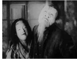
図 3 (1:07:27)

ところが、続くラストシーンには近代医療制度への批評性よりも、むしろ従順な面が現れる。妻を病院から連れ出すことに失敗した小使いは、患者たちに能面を被せていく。すると、患者たちは大人しくなる。妻にも仮面を被せ、自身も仮面を付けると、妻を従えて、小使いにとって理想的な夫婦のように振舞う (図 3)。このシーンは現実ではないが、夢だとも示されていない。「病室」の鍵を管理する権限を失った小使いは、精神病院が夢か現実か曖昧な空間と化したときに、妻を従える理想を実現させる。