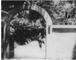
図 2 (0:26:24)