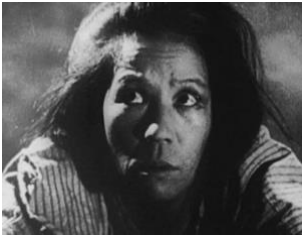
図 8 (0:07:37)