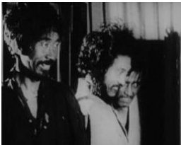
図 12 (0:56:32)

さらに、その境界線によって生じる精神病者の表象にはジェンダーが刻まれている。男性の精神病患者を見てみよう。視線については女性と同じように扱われているが、身体については決定的な差異が刻み込まれている。例えば、男性患者たちは医者による診察を素直に受けた後は整列して「病室」へ戻っていき (0:18:44-0:19:27)、小使いが妻を連れ出そうとしたところでは揃えて口を開け (図 12)、能面を被せられる直前には揃えて腕を振っている (図 13)。男性患者たちは、能面を被せられる以前から動きを揃えた規律正しい身体を持っている。一方、一人で踊り続ける踊子だけでなく、カメラが左へ回転しながら次々に自由に振る舞う女性患者たちを映していくシーンなど (0:19:28-0:20:16)、女性の身体は統制されていない。精神病患者の表象には、明確な男女の差がある。