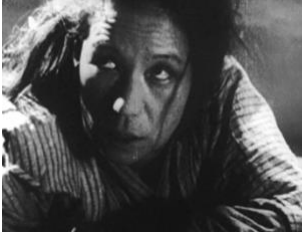
図 6 (0:07:25)