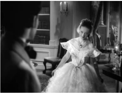
図5 プレスの様子を窺うジュリー (00:52:42)

では、リーが演じるスカーレットに目を転じよう。リー／スカーレットの場合、「本心」が表面に溢れ出る様を通して彼女の二面性は表象される。映画版において、リーは、スカーレットが意中の人間であるアシュレーやレットを前にした時、自分の身体を投げ出す動作を繰り返す（図6）。レット（クラーク・ゲブル）がスカーレットに結婚を申し出る場面で、スカーレットはレットからのキスを口では断りながらも、二人の間の距離は限りなく消失し、彼女の身体は前のめりで、目は閉じられ、顎が突き出されている（Part2, 01:03:46）。身を乗り出す様子からは、スカーレットが口づけを求めていることが明らかだ。